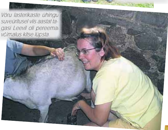
Võru lasterikaste ühingu suveüritusel viis aastat tagasi Leevil oli pereema võimalus kiltse lüpssta.