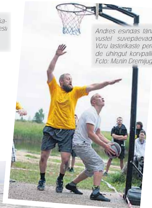
Andres esindas tänavustel suvepäevadei Võru lasterikaste perede ühingu korvpallis.