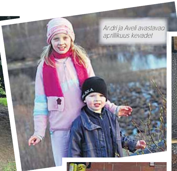
Ar.dri ja Aveli avastavao aprillikus kevadet