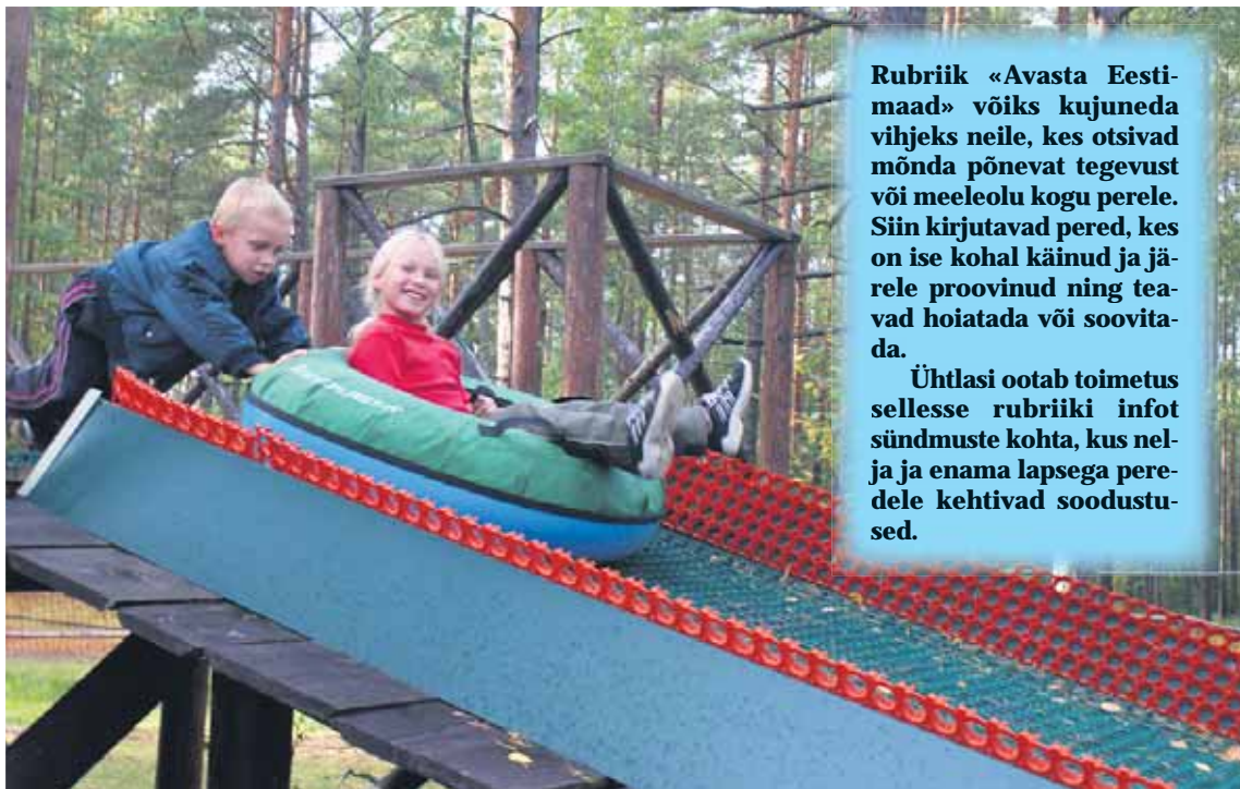
Alutagusel saab lumerõngaga sõita ka suvel.

Täiskasvanutele on aktiivseid tegevusi seiklusparkis päris laialt.