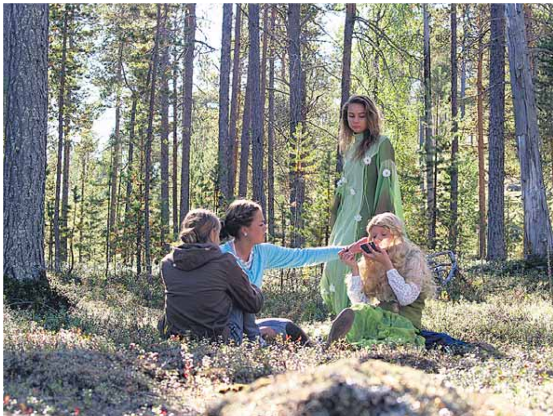
Metshaldjad Lapimaal. Sõidu eel uurisid noored oma maa müütilisi tegelasi ning kehastusid nendeks fotosessioonil Lapimaa looduses.

Enne ärasõitu püüdsime grupijuhtidena võimalikult põhjalikult tutvustada noortele ja nende peredele projekti sisu, tegevuskava, igapäevaelu tingimusi, koos vaatasime üle vajaminevate asjade nimekirja, leppisime kokku põhilistes reeglites ning selles, kes mida veel enne minekut teeb. Selles etapis oli põhiliseks ühest küljest osalejate motiveerimine, aga ka neile vastutuse andmine – kõigi osalejate ühisest panusest oleme see, kuidas projekt õnnestub. Pidasime oluliseks meeskonna-