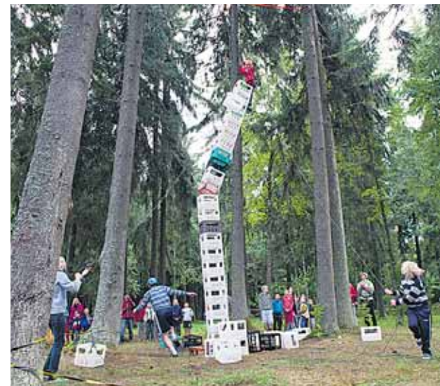
Tegevust leidis iga osavõtja, popimaks kujunes kaslitori ronimine, mis ei tahtnud katkeda isegi ootundidel. Võistlusmomente tekkis korvpallis, rahvastepallis, võrkpallis ja muudel aladel. Põnevust pakkusid teatevõistlus tiigritrajal, trummituba ja geoseiklus.