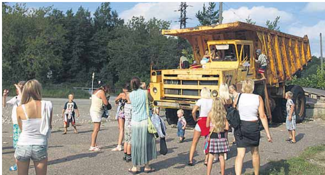
Kohtla kaevandusparkis meelitas kallurauto Belaz lapsed kabiinini turnima.