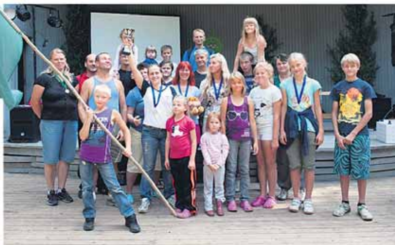
Eesti lasterikaste perede liidu suvepäevade rändkarika võistles välja Tartu pereliit.