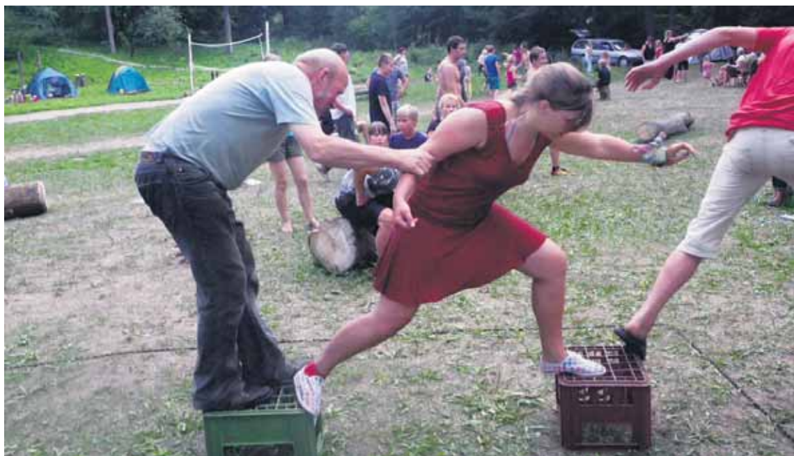
Käib suvepäevade lemmikala, Onu Ralfi teatevõistlus, kus igast perest osaleb neli inimest.

Virumaa suured pered tänavad ilmataati, kes andis meile hea ilma, samuti toetajaid, kes leidsid võimaluse raskel ajal üritusele õlg alla panna.