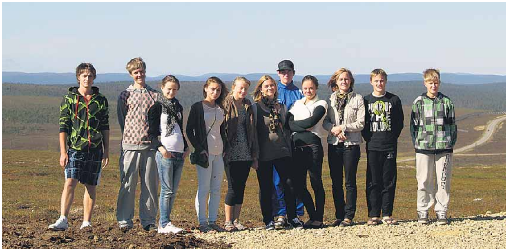
Augustikuisele õpireisile Lapimaa eelnes Viljandimaa noorterühma mitmekuine ühistöö, et kasvatada ideest noori huvitav tegevuskava ning rahatuge pakkuv projekt.