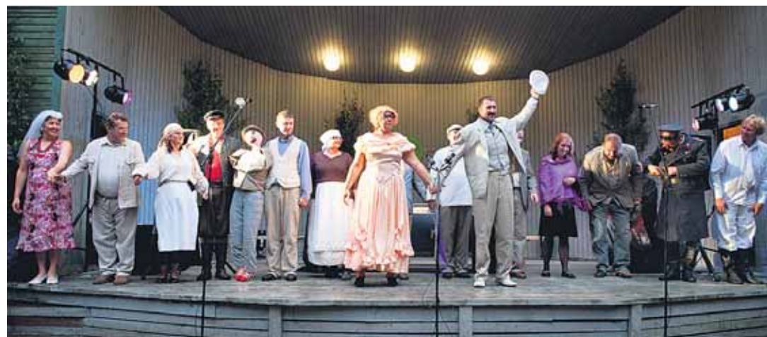
Viljandimaa vallavanemate humoorikas etendus ei jätnud külmaks ühtegi täiskasvanut. Kui põnnide jaoks oli tüks ehmatamapanevaid pauke, siis vanemate naer rökkas üle Ulge ranna.