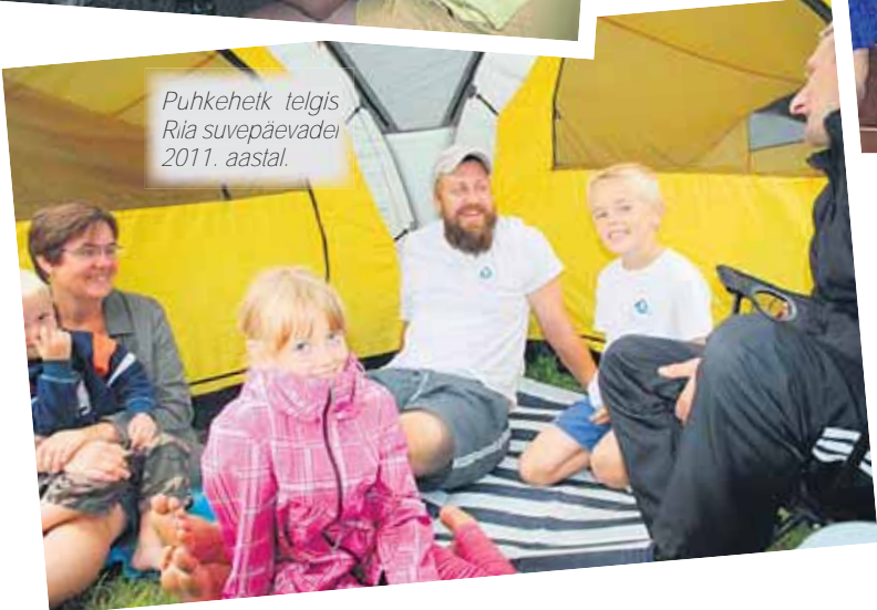
Puhkehelk telgis Riia suvepäevadei 2011. aastal.