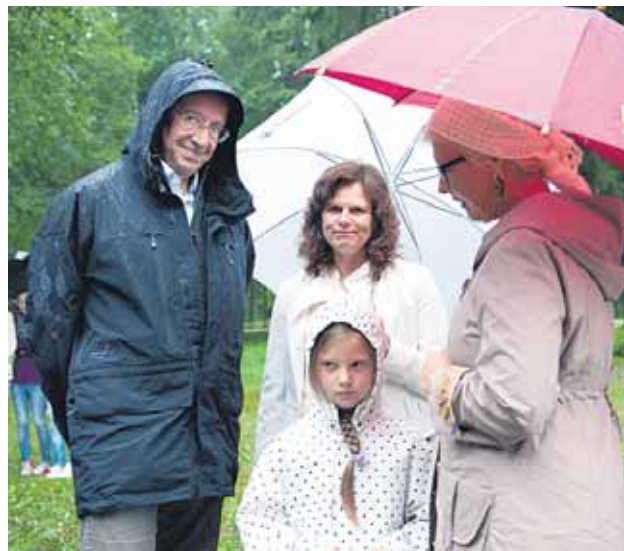
Vihmast avamispäeva austas oma külaskäiguga presidendipere. Kohutamine tõi rõõmu igale väiksele käharpeale ja mummale-papale. Meid on märgalud!