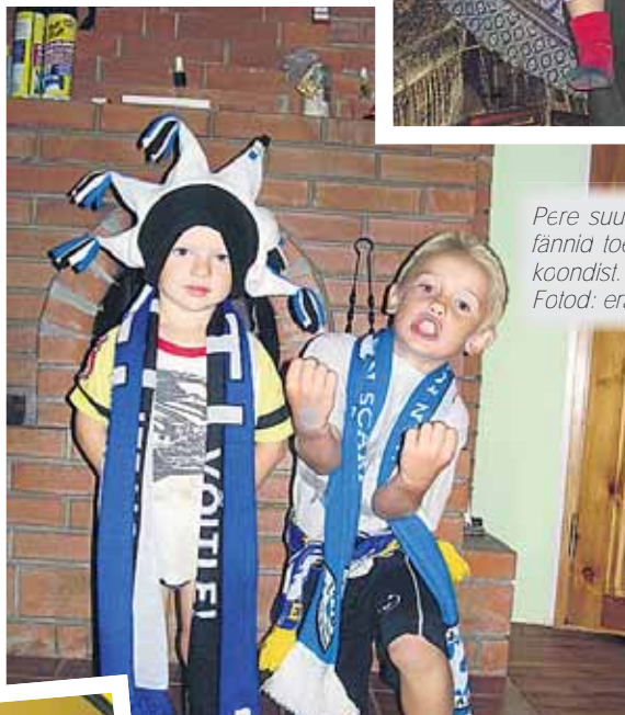
Pere suurimad jalkafännia toetavad Eesti koondist.