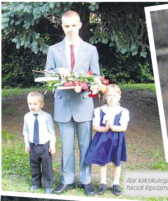
Alar kaksikutega põhikooli lõpetamisei

Mul on hea meel, et meil on nii tore ja ühtehoidev pere.